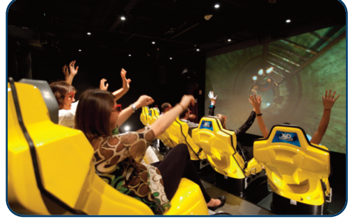
Interaktives 4D Kino