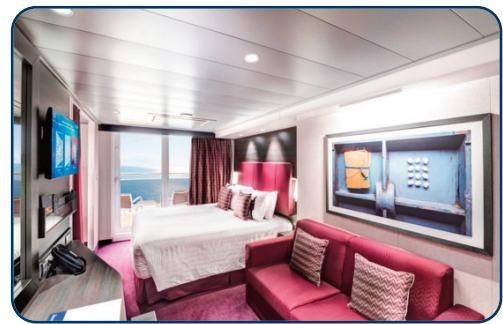
Wohnbeispiel einer Balkonkabine