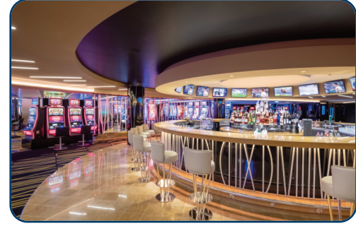
Großer Casinobereich mit Bar