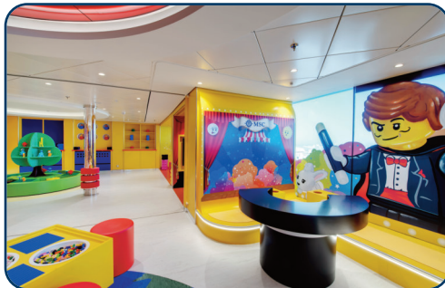
Mini-, Kinder, Junior- und Teensclubs