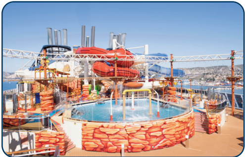
Aquapark mit Rutschen und Kletterpark