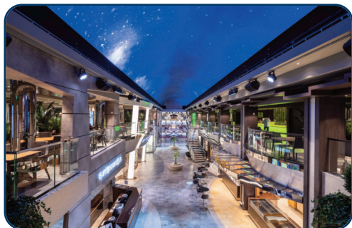
Ca. 100 m lange Promenade mit LED Himmel