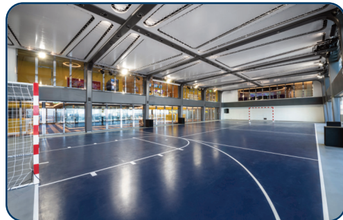
Riesige Multi-Sporthalle über 2 Decks