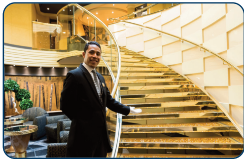
Willkommen an Bord!