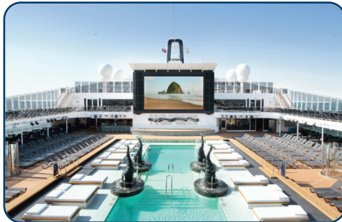
Großzügige Poollandschaft mit Liegen