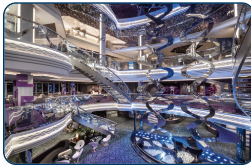
Das atemberaubende Atrium