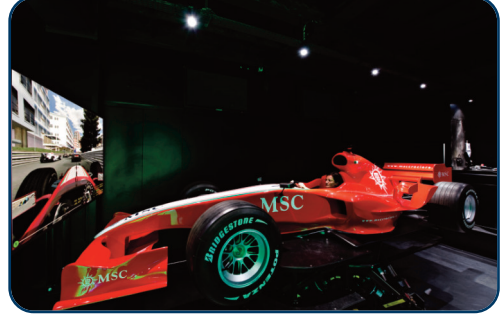
Formel 1 - Simulator

Impressum: Reisebüro Kramer - Inhaber Guido Kramer - Schwabacher Str. 261 - 90763 Fürth - Gerichtsstand: Fürth / Bayern Das o. g. Reisebüro tritt grundsätzlich als Vermittler fremdveranstalteter Pauschalreisen auf. Es wird ein Geschäftsbesorgungsvertrag gemäß § 675 BGB vereinbart. Im Falle einer Buchung finden für den Inhalt des vom o. g. Reisebüros vermittelten Vertrages zwischen Ihnen und dem Erbringer einer Reiseleistung die Tarif-, Beförderungs- und Allgemeinen Reisebedingungen der an der Reise beteiligten Leistungsträger ausschließlich Anwendung. Die jeweiligen Allgemeinen Geschäfts- und Reisebedingungen des Reiseveranstalters, Vorabinformationen zu Ihrer Reise und Einreisebestimmungen sowie unsere Allgemeinen Geschäftsbedingungen zur Reisevermittlung stellen wir Ihnen gerne vor Buchung zur Verfügung. Alle ausgeschriebenen Preise, Leistungen und Termine vorbehalten Irrtümer oder Druckfehler. Reiseveranstalter: MSC Cruises S.A., Avenue Eugène-Pittard, 40, 1206 Genf (Schweiz), Zustellungsbevollmächtigte Deutschland: MSC Kreuzfahrten GmbH, Garmischer Str. 7, 80339 München