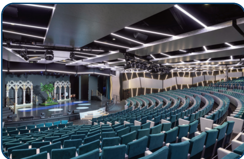
Theater mit täglichen professionellen Shows